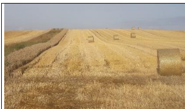
Froment et autres non récoltés (ha)